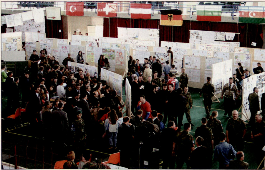
Militärs und Bevölkerung kommen einander näher – Ausstellung der Plakate.

völkerung gross. Aber es gibt sie, die vielen kleinen Verbesserungen und Entwicklungen. Diese müssen sichtbar gemacht werden, um dem Volk Mut und Durchhaltewillen einzuflössen.