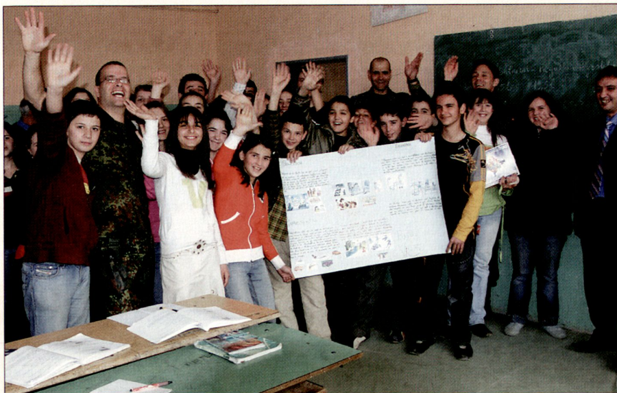
Liaison and Monitoring Teams (LMT) der KFOR prämiieren die Arbeit eine Schulklasse.