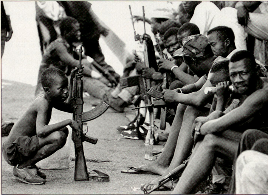
Kindersoldat aus Sierra Leone 2000.