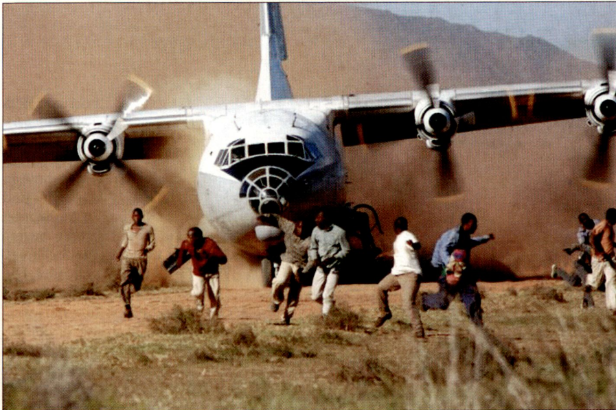
Nachschub aus der Luft für Kindersoldaten.