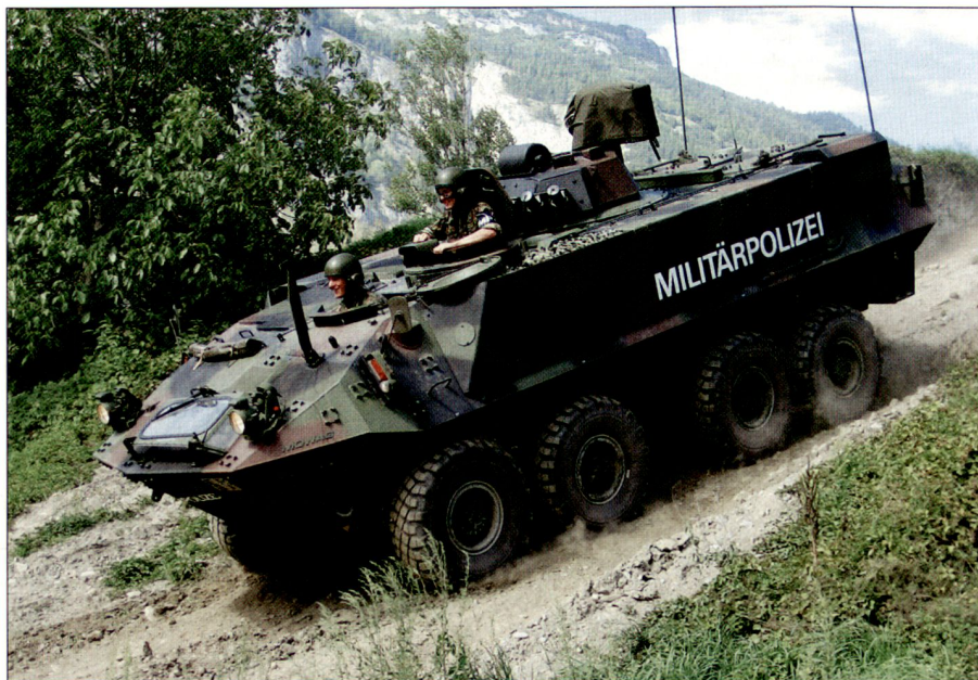
Radschützenpazer der Militärpolizei.

Während zahlreicher Einsätze in den vergangenen Jahren, wie beispielsweise «WSIS» (Objekt- und Konferenzschutz zur Entlastung der Genfer Kantonspolizei anlässlich des UNO-Informations- und Kommunikationssymposiums), «AMBA CENTRO» (Botschafts-, Missions- und Konsulatsbewachungen in Bern, Genf und teilweise Zürich) sowie «AQUA 0805» (Schutz- und Sicherungsaufgaben in Ver-