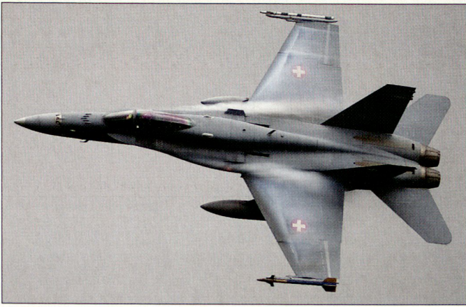
Schweizer F/A-18 über dem Zielgebiet Heuberg.