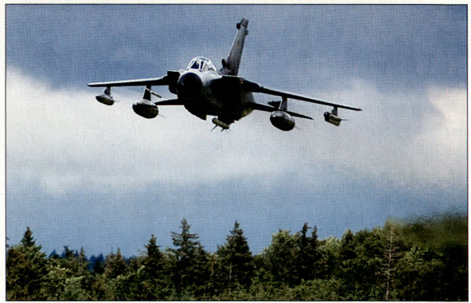
ECR Tornado mit voller EKF-Ausrüstung im Angriff.

Radar TIN SHIELD. Und als Blick in die Zukunft testete schliesslich eine deutsche Forschungsgesellschaft das Passivradar CORA, das explizit für die Detektion von Stealth-Flugobjekten in niederen Flughöhen eingesetzt werden soll.