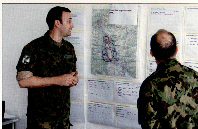
Die Feuerunterstützungsoffiziere der Kampfbrigade erarbeiten Feuerführungskonzepte und präsentieren diese dem Bataillon.

oberfläche. Die Fahrer absolvierten ein Repetitorium auf DURO und EAGLE, während die FUOf die Feuerführungskonzepte für die nachfolgenden Übungen erstellten. Am Abend standen Material- und Funktionskontrollen einerseits, klassische Eintrittstests mit Fragen aus den Bereichen Taktische Führung, Zielbestimmung, Uem D, INTAFF und Gerätekenntnis andererseits auf dem Programm.