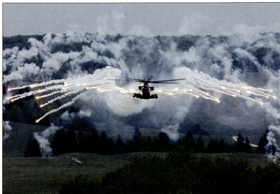
Einsatz von Flares durch deutsche CH-53.

Als weitere Überraschung setzten die Ungarn auch zwei Radartypen ein, die unterschiedlicher nicht sein könnten, nämlich das archaisch anmutende Meterwellenradar SPOON REST, dem die Detektionsmöglichkeit von Stealth-Flugobjekten nachgesagt wird, und das moderne 3D-