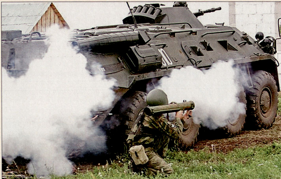
Übung «Friedensmission 2007».

der Nationalen Sicherheit (2000), die Grundlagen der Politik der Russischen Föderation auf dem Gebiet der militärmaritimen Tätigkeit bis 2010 (2000), die Militärdoktrin (2000), die Konzeption der Aussenpolitik (2000) und die Marinedoktrin (2001). Im Dezember 2005 ist durch den Generalstabschef die Ausarbeitung einer neuen Doktrin angekündigt worden. Seit 2004 ist die Verstärkung der zivilen politischen Kontrolle über das Militär nicht mehr nur ein Lippenbekenntnis. Mit dem neuen Verteidigungsminister Serdjukow ist 2007 nach Sergej Iwanow ein weiterer Zivilist an die Spitze des Militärapparates berufen worden.