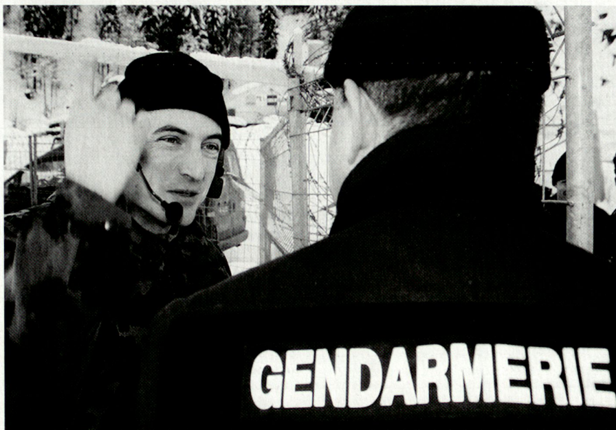
Collaboration entre l'armée et la police en matière de sécurité intérieure: World Economic Forum (2006).

(art. 92 Cst.) ou de l'énergie nucléaire (art. 90 Cst.). La Confédération protège également l'ordre constitutionnel des cantons lorsque ces derniers ne sont pas en mesure de garantir le fonctionnement des institutions (art. 52, al. 2, Cst.).