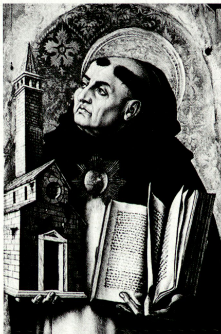
Thomas d'Aquin: le père de la subsidiarité. Source: retable Demidoff par Carlo Crippelli (1476), National Gallery, Londres

Bien qu'étymologiquement d'origine militaire, le principe de subsidiarité, en tant que principe d'ordonnement social, trouve sa source dans la philosophie, et plus particulièrement dans l'enseignement de Thomas d'Aquin. Ce dernier assigne au