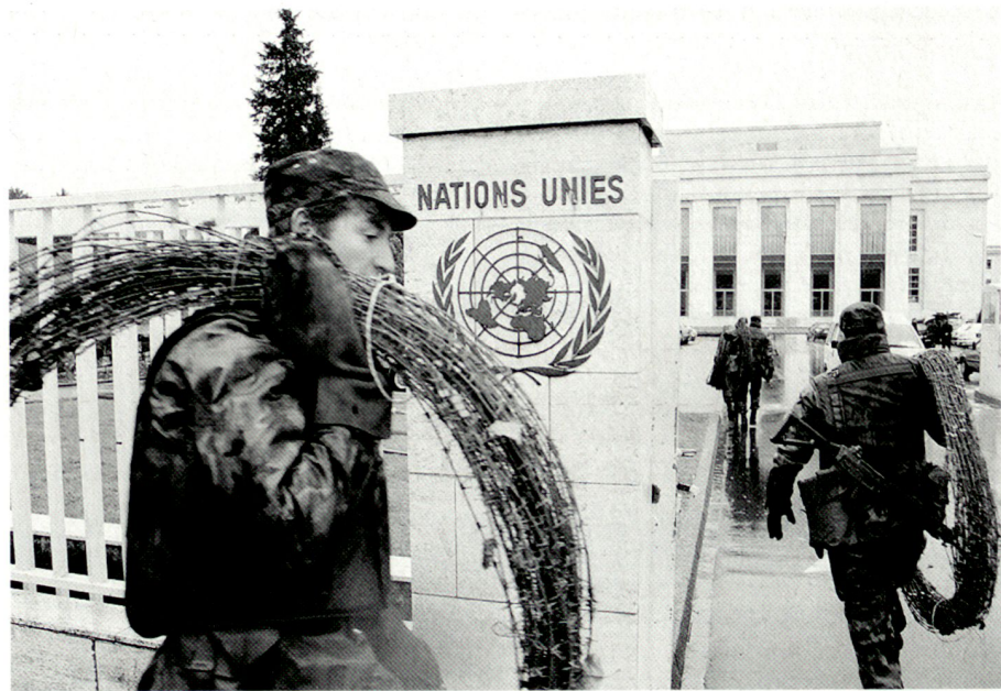
Engagement subsidiaire de sûreté: surveillance de bâtiments protégés par le droit international public.

Pour l'année 2007, les tendances fondamentales se maintiennent. Au cours du premier semestre 2007, 240 942 jours de ser-