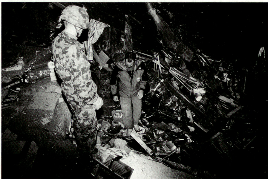
Aide en cas de catastrophe: glissement de terrain à Gondo (2000).

défense militaire des années 80. 16 Le recours à la troupe n'est envisagé que comme ultima ratio , notamment en cas d'actions massives à main armée contre l'ordre constitutionnel