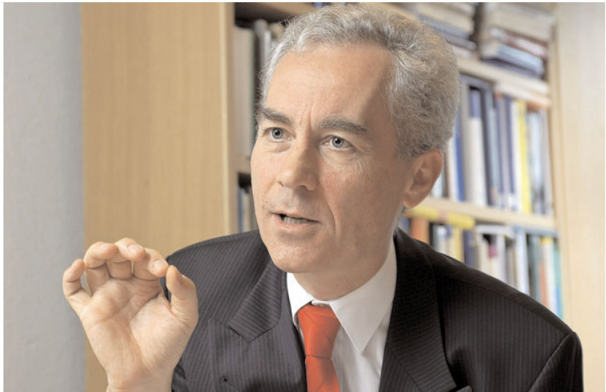
... es auf den Punkt bringen ...

Truppenübungen prägen von allem Anfang an unsere Arbeit. Im Jahre 2004