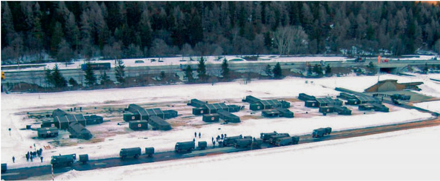
6 MSE 2 (San Hist) Flugplatz Ambri.

Die Kader und Soldaten der Sanitätsschule 42 werden in folgende Verbände eingeteilt: MSE 1 (Stufe Bataillon), MSE 2 (Stufe Sanitätskompanie), oder als Sanitätsdurchdiener in einer MSE 2.