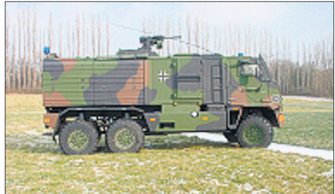
Als Träger moderner Mittel gegen Sprengfallen ist auch das geschützte Mehrzweckfahrzeug «YAK» vorgesehen.

Mit der Aufstellung eines alleinverantwortlichen Ausbildungszentrums Heeresaufklärungstruppe am Standort Münster soll das gemeinsame Verständnis für die Heeresaufklärung in der einsatzoptimierten Struktur «Neues Heer» optimiert werden. Nach einer ca. halbjährigen Übergangszeit soll bereits ab April 2008 die volle Übernahme des Lehr- und Ausbildungsbetriebes an diesem Standort erfolgen.