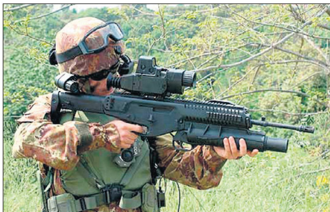
Prototypen des Ausrüstungsprogramms für den «Soldato Futuro» werden gegenwärtig in der italienischen Infanterieschule getestet.

Wie dies auch bei anderen Armeen vorgesehen ist, soll mit der Integration moderner Technologien vor allem die Durchhalte- und Überlebensfähigkeit der Infanteristen verbessert werden. Zudem soll damit auch ein Einsatz unter extremen klimatischen Bedingungen und der Kampf gegen irreguläre Truppen und asymmetrisch kämpfende Kräfte ermöglicht werden.