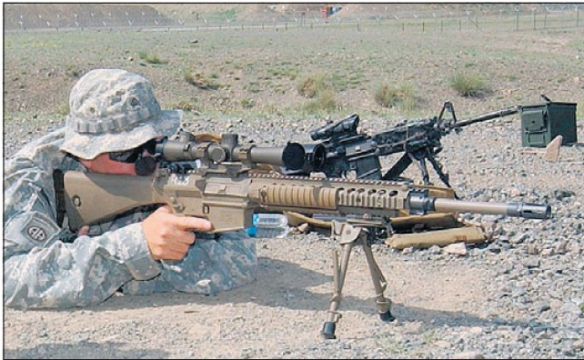
Neue Scharfschützengewehre M-110 «SASS» für die US Army.

Gegenwärtig wird den Infanterieeinheiten der US Army zudem ein neues Wirkmittel für den Kampf gegen Untergrundkämpfer