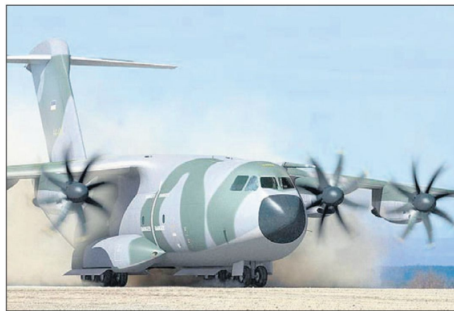
Schwierigkeiten bei der Entwicklung der Triebwerke für das neue europäische Transportflugzeug A400M.

In der Zwischenzeit werden bei NATO und EU die bestehenden Lücken beim Lufttransport mindestens teilweise mit der Interimslösung «Salis» überbrückt. Eine Weiterführung dieses Leasingvertrages für die Grossraum-Transportflugzeuge An-124 ist aber nicht nur unzweckmässig, sondern auch mit hohen Kosten verbunden. Mit Sicherheit sind einige der europäischen Streitkräfte auf eine möglichst rasche Beschaffung der von der NATO bewilligten drei amerikanischen Schwertransporter C-17 «Globemaster III» angewiesen. ■