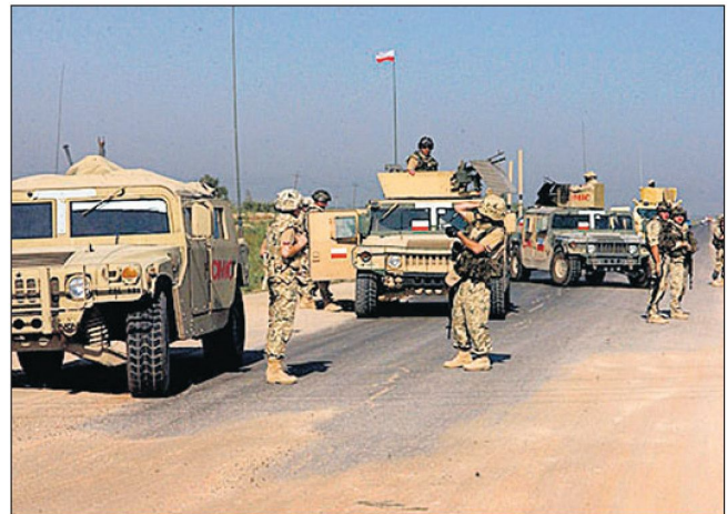
Polnische Truppen im Irak: auch Polen will in diesem Jahr seine Truppen abziehen.

Jahr wesentliche Truppenreduktionen geplant. Die USA selber sind daran, die im letzten Jahr zugeführte Verstärkung von 30'000