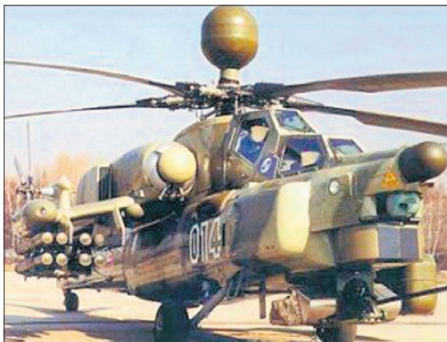
Der Kampfhelikopter Mi-28N ist bei den russischen Streitkräften als Nachfolger des Mi-24 «Hind» vorgesehen.

seit Jahren daran gearbeitet wird. Der Kampfhelikopter Mi-28N kann entweder mit 16 Panzerabwehrlenk Waffen «Ataka» oder auch mit Raketenpods unterschiedlicher Anzahl und Kaliber bewaffnet werden. Zudem können je nach Bewaffnungskonfiguration auch bis zu acht Luft-Luft Lenk Waffen «Igla» mitgeführt werden.