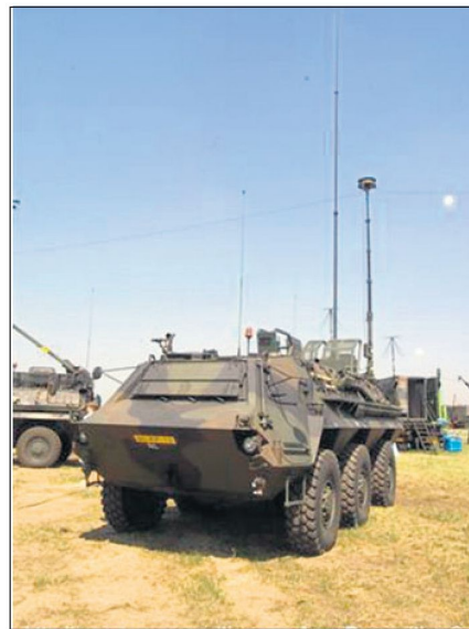
Mobile Störssysteme «HF Hornisse» für die niederländische Armee.

Multinationale Truppen, die für friedensunterstützende oder Stabilisierungsoperationen eingesetzt sind, müssen daher vermehrt mit leistungsfähigen EKF-Mitteln (für Aufklärung und Störung) ausgerüstet werden. Das für die Niederlande vorgesehene mobile System «KWS EloGM HF Hornisse» ist eine Weiterentwicklung des bisherigen Störsystems HF, das bei diversen Streitkräften im Einsatz steht. Das auf dem Radfahrzeug «Fuchs» integrierte neue EKF-System kann im Verbund oder autonom betrieben werden. Die Erfassungs- sowie Analyse- und Störfähigkeit ist für den Frequenzbereich von 1,5 bis 30 MHz ausgelegt. Die stufenweise einstellbare Störleistung beträgt maximal 1000 Watt. Die neuartige Reusenantenne, die sich durch ihre Bandbreite und die Möglichkeit zur automati-