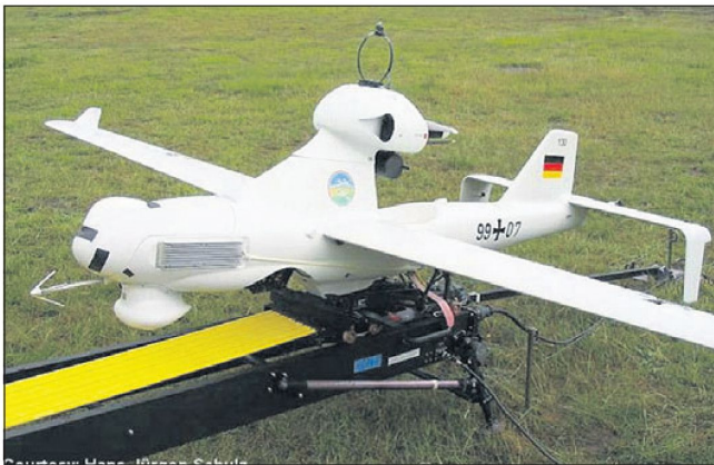
Alle Aufklärungsverbände und -einheiten der Bundeswehr verfügen künftig über unbemannte Luftaufklärungsmittel (Bild: Drohne für die Nahaufklärung «LUNA»).

Schutz im Einsatz – das bedeutet nicht nur die uneingeschränkte Nutzung geschützter und gepanzerter Fahrzeuge, sondern eine Vielzahl geeigneter Massnahmen im Rahmen der für künftige Einsätze geforderten umfassenden «Force Protection».