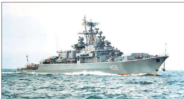
Die russische Fregatte «RFS Ladnyj» hat an der NATO-geführten «Operation Active Endeavour» im Mittelmeer teilgenommen.

hat im September 2007 das zweite russische Kampfschiff, die Fregatte «RFS Ladnyj» in der Nachfolge der «RFS Pitlyvi», an diesbezüglichen Überwachungsmissionen im Mittelmeer teilgenommen. Vorausgegangen waren