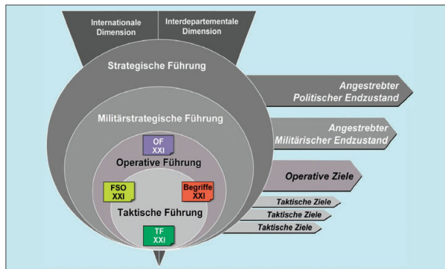
Abb 1: Einbettung der militärstrategischen Führung.

Ist diese Teilstrategie von der politischen Stufe – allenfalls mit Korrekturen – genehmigt, so formuliert der MSS die militärstrategischen Richtlinien (MSR) für den (militärischen) Kommandanten des eingesetzten Verbandes, welcher seinerseits den Operationsbefehl erstellt. Es handelt sich dabei um den Chef des Führungsstabes der Armee, oder – bei grösseren Einsätzen – um einen «Joint Force Commander».