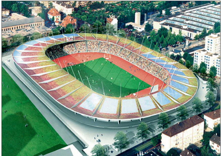
Das neue Letzigrund-Stadion besticht durch seine Eleganz.

Glücklicherweise können wir seit einiger Zeit an diesem Objekt bereits trainieren. Eine Stabsrahmenübung und eine grosse Einsatzübung wurden mit allen Kräften der polizeilichen und nichtpolizeilichen Gefahrenabwehr so-