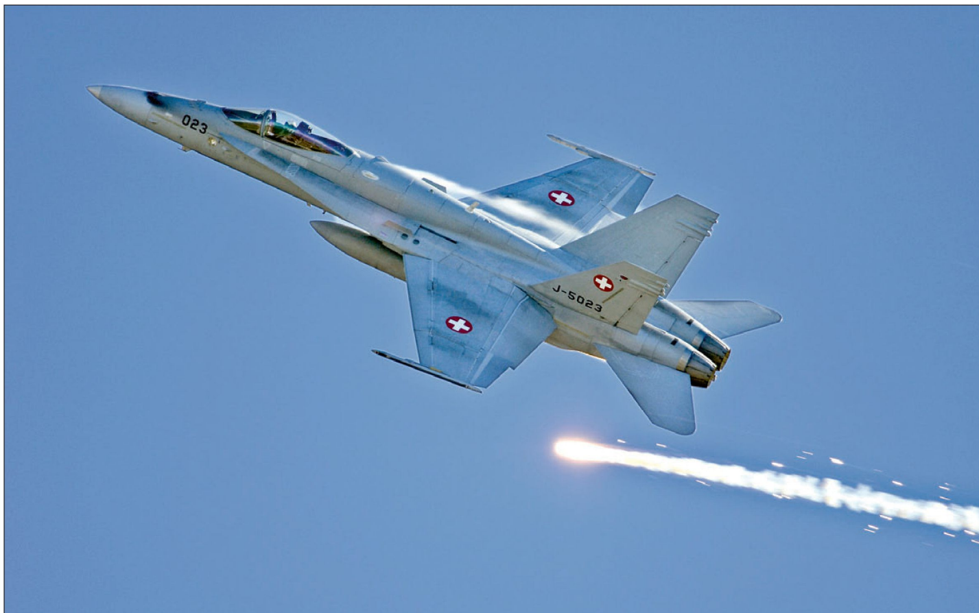
Ein F/A-18 stösst im Sinne eines Warnschusses Leuchtfackeln (Flares) aus (Mission Intervention).