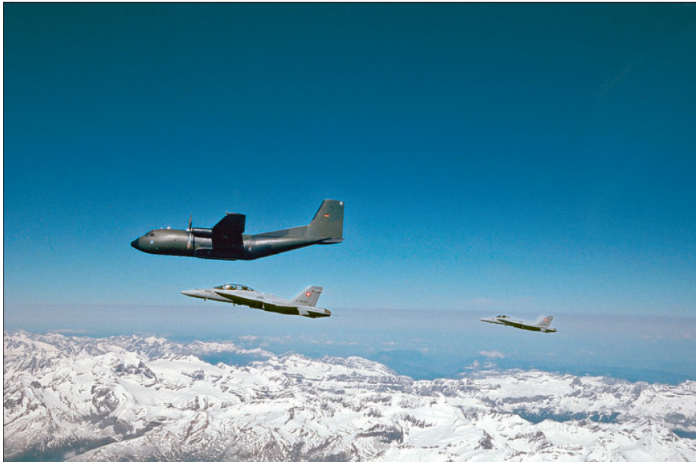
Eine Patrouille F/A-18 identifiziert eine deutsche C-160 Transall (Mission Identification).

Radar, wie der F/A-18. Mittels Datalink, kann das Radarbild eines modernen Flugzeuges in die allgemeine Luftlage integriert und auch die allgemeine Luftlage auf die Bildschirme im Cockpit des Kampfflugzeuges übertragen werden. Unser F/A-18 und auch andere moderne Kampfflugzeuge sind mit diesem Datalink (MIDS/LINK 16) ausgerüstet.