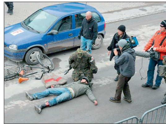
Unter Beobachtung der Medien ist das Verhalten eines jeden Soldaten entscheidend.

Sodann ist der operativen Schulung wieder der Stellenwert zurückzugeben, den sie einmal hatte. Entsprechend dem heutigen Bedrohungsspektrum sind interdepartementale Übungen zu entwickeln. Dabei muss die oberste Exekutive regelmässig und zwingend eingebunden werden. Das bedeutet, die Effect-Based Operations sind noch stärker bekannt zu machen und zu schulen. Wenn die höchste Führungsebene der Schweiz beübt werden soll, müssen der operativen Schulung entsprechende Kompetenzen verliehen