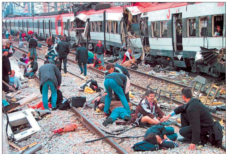
11. März 2004, Madrid: Effect-Based Operations für das schmale Budget.

Jede Änderung ruff ihre Kritiker hervor. 8 Aufgrund der Einsatzerfahrungen im Irak wurde bemängelt, dass der technologisch-wissenschaftliche Ansatz nicht unbedingt ausreicht. Die militärischen Operationsziele konnten zwar grösstenteils erreicht werden, jedoch zeigte sich, dass auch eine langfristige Raumsicherungs- und schliesslich eine Exit-Strategie von Nöten ist. Auch auf operationeller Stufe bleibt l'art de la guerre sowie die humanistische Grundhaltung der Kader entscheidend. Gefordert ist auch in Zukunft nicht das Mikromanagement, son-