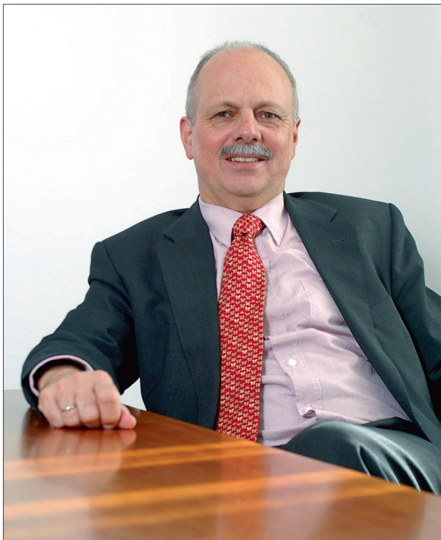
Wer dazu befähigt ist, hat die Pflicht, Offizier zu werden.

Der Chef VBS fordert in Bezug auf die Weiterentwicklung der Armee «mehr Gegenwart und weniger