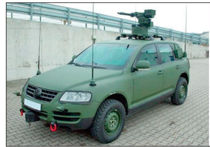
Militärversion des «Touareg».

VW und 20 «Dingo 2» beschafft worden. Für den nächsten Schritt sind 150 Fahrzeuge in der «Dingo»-Klasse ausgeschrieben worden. Darüber hinaus werden 170 kleinere geschützte Fahrzeuge in der «Eagle»-Klasse und 60 grössere 6x6 oder 8x8 Radfahrzeuge gesucht. Dabei steht natürlich eine weitere Beschaffung von gepanzerten Radschützenpanzern «Pandur» von Steyr Spezialfahrzeuge im Vordergrund. Damit soll auch eine möglichst hohe Wertschöpfung auf Österreich konzentriert bleiben. Gemäss Aussagen der Bundesheerführung sollen künftig bei Auslandseinsätzen wenn immer möglich nur noch geschützte oder ge-