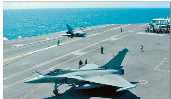
Kampfflugzeuge «Rafale» auf französischem Flugzeugträger.

Für die französischen Luftstreitkräfte (rund 50 000 Mann) sind im Weissbuch noch 300 Kampfflugzeuge («Rafale») und modernisierte «Mirage 2000») vorgesehen. Die Marine soll