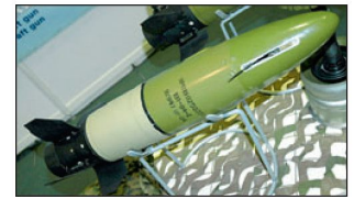
Lasergelenkte Panzermunition 125 mm AT-11.

bis 30 Panzer pro Jahr) des T-90S vorhanden. Dazu kommt als einziger Exportauftrag die laufende Lieferung von T-90S an Indien. Uralvagonzavod will sich gemäss eigenen Aussagen auf die Weiterentwicklung und laufende Verbesserung des T-90 konzentrieren. Dieser Panzer wurde denn auch in einer weiter modernisierten Version dynamisch und beim Schies-