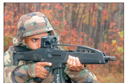
Versuche mit Sturmgewehr XM8 bei der US Army.

besten abgeschnitten haben. Diese Schiessversuche fanden in der von der US Army betriebenen Versuchseinrichtung Aberdeen Proving Ground in Maryland statt, wobei vor allem der Waffeneinsatz unter extremen Umweltbedingungen getestet wurde. Denn Erfahrungen sollen aufgezeigt haben, dass beim amerikani-