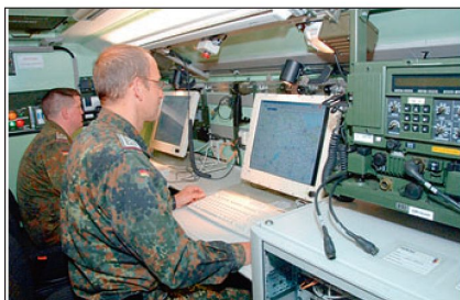
Deutsche Führungsmittel für militärische Einsätze der EU.