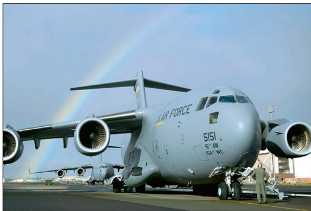
Transportflugzeug C-17 «Globemaster III».

Unterdessen haben auch US-Politiker Stellung bezogen und verlangen eine seriöse Abklärung. Mit umfassenden Untersuchungen und Vergleichsschiessen soll gewährleistet werden, dass die amerikanischen Soldaten künftig mit den besten und zuverlässigsten Waffen ausgerüstet werden.