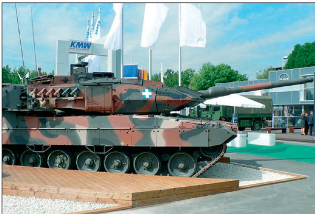
Modernisierter Kampfpanzer «Leopard 2 A6 HEL».