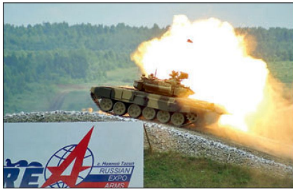
Schiessdemonstration Kampfpanzer T-90S.