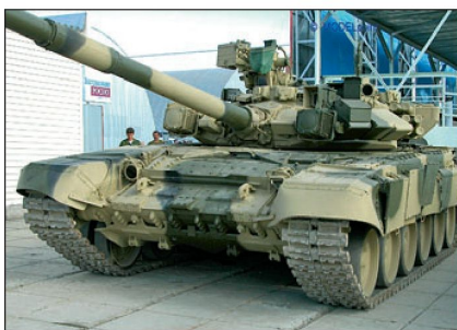
Neuste Version des Kampfpanzers T-90S.

Für die vorgestellten Waffensysteme wurden diverse Modernisierungsmöglichkeiten aufgezeigt, wobei bei den Gefechtsfahrzeugen Optionen zur Verbesserung von Schutz, Feuerkraft und Mobilität angeboten wurden. Als Möglichkeiten zur Verbesserung des Schutzes wurden einerseits ballistische Schutzmassnahmen wie Hohlladungsschutzgitter und Reaktivpanzerung präsentiert, andererseits wurden auch abstandsaktive Schutzsysteme (beispielsweise «Shtora-2») gezeigt. Erwähnenswert ist dabei die neu entwickelte ERA 4S23 «Relikt» (Explosive Reactive Armour), die nicht nur gegen Hohlladungen sondern auch gegen Panzerwuchtgeschosse einen verbesserten Schutz bieten soll.