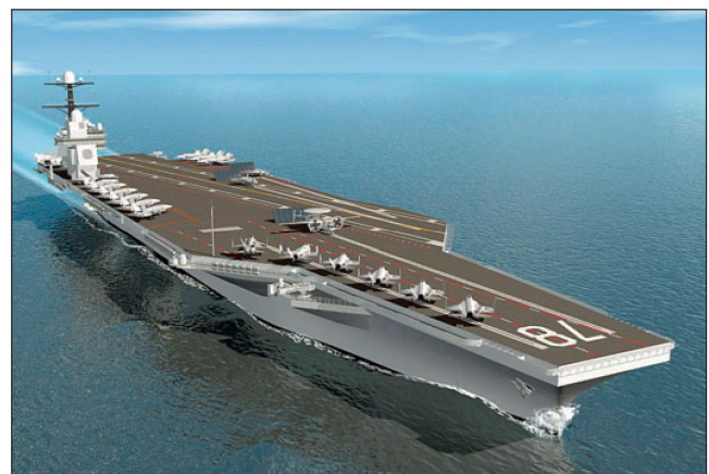
Skizze des neuen US Flugzeugträgers CVN-78.

Gerald R. Ford war bekanntlich der 38. Präsident der USA; er diente im Zweiten Weltkrieg als Kapitänleutnant auf dem Flugzeugträger «USS Monterey» (CVL-26).