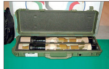
Transportbehälter mit Raketenrohr RPG-32.

Anlässlich der Ausstellung «Expo Arms 2008» wurde einmal mehr die Wirkung von Panzerfäusten sowohl mit Tandemhohlladung- als auch mit thermobarischen Gefechtsköpfen demonstriert. Nebst den bisher bekannten Typen RPG-7, RPG-26, RPG-28 und RPG-29 wurde an der Ausstellung erstmals die neue tragbare Waffe RPG-32 vorgestellt. Das neue Raketenrohr RPG-32 «Kashim» wurde in Zusammenarbeit zwischen Bazalt und der jordanischen Armee entwickelt. Die Waffe mit