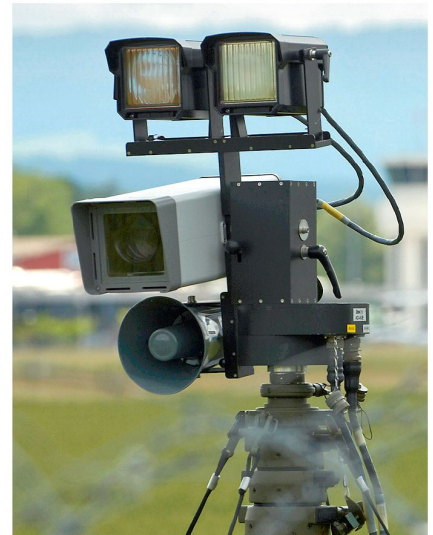
Überwachungssystem auf dem Belpmoos anlässlich der EURO 08.

Zusammenfassend darf festgehalten werden, dass ein qualitativ hochstehendes Schweizer Produkt nicht nur im eigenen Land sondern auch bei anderen Armeen erfolgreich im Einsatz steht, um die Truppe bei Sicherungs- und Bewachungsaufgaben zu unterstützen und zu entlasten.