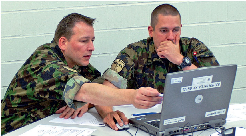
Studenten des Diplomelehrgangs 08/09 erarbeiten systematische Entscheidungsgrundlagen.

Kurs durchgeführt worden ist, bezeichnet etwa die Hälfte das Modell als interessant, die andere Hälfte erkennt einen direkten Nutzen für ihre aktuelle Tätigkeit. Die Modelle werden nun in Zusammenarbeit mit dem WK-Soldaten-Pool 1 der Dozentur verbessert im Hinblick auf die zweite Durchführung des Kurses im Rahmen des