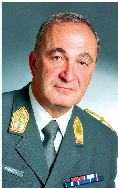
Generalmajor Mag. Friedrich Weber, Leiter HNAA.

andere Ministerien. Generalmajor Weber ist überzeugt, dass die Einbettung des HNAA in die militärischen Strukturen «im Lichte der Aufgabenteilung der Bundesregierung und der daraus resultierenden, sicherheitspolitischen Agenden des BMLVS» durchaus Sinn mache. Erfülle doch das HNAA neben der «gesamtstaatlichen Aufgabe der Erstellung des strategischen Lagebildes für die oberste politische und militärische Führung» auch Aufgaben im Bereich der Vorbereitung und Begleitung von Auslandsmissionen des Österreichischen Bundesheeres im Sinne der «Force Protection».