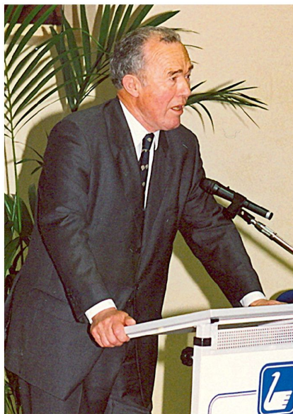
Oberst i Gst Frédéric de Mulinen, Gründer der multinationalen Kriegsvölkerrechtskurse in Sanremo.

Dank seiner Tätigkeit beim Internationalen Komitee vom Roten Kreuz (IKRK) und mit Unterstützung der Schweizer Armee konnte Oberst de Mulinen seine Ideen verwirklichen. Konkret baute er beim renommierten Internationalen Institut für Humanitä-