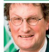
Geri Müller Nationalrat GPS 5400 Baden

Trotz der marginalen Bedeutung der Rüstungsindustrie für das BIP – in der Schweiz erwirtschaftet sie ein Prozent des Volkseinkommens – ist der Glaube, zu einem rechten Land gehöre die Bereitstellung von Kriegswaffen, tief verankert. Darauf gründet auch die Vorstellung, dass Innovationsfähigkeit und Erfindungsgeist einer Nation abhängig sind von der Rüstungsindustrie und ihrer Fertigkeit. Dies alles beruht auf dem uralten Mythos, das Wohl eines Landes basiere auf seiner Wehrhaftigkeit. Tatsächlich aber passieren Entwicklungen vielmehr aufgrund von Kooperation als von (kriegerischer) Konkurrenz. Der schweizerische Bundesstaat entstand 1848 erst, als die Waffen zwischen den Liberalen und den Katholisch-Konservativen endlich ruhten. ■