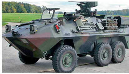
Kdo Pz 6x6.