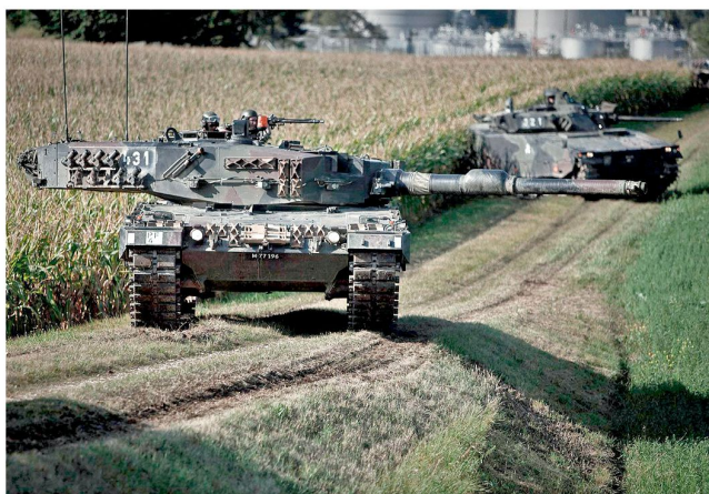
«Force mix» – Die Pz Kp 28/4 bestreitet die Übung PROTECTOR mit gemischten Zügen aus Kampfpanzern 87 Leopard und Schützenpanzern 2000.