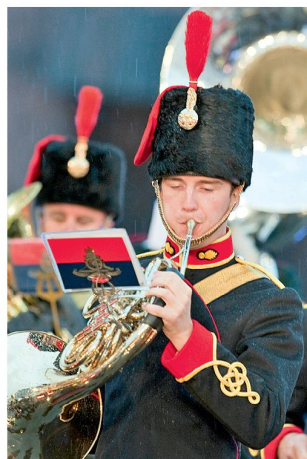
Royal Artillery.