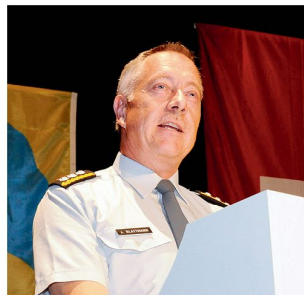
Eindringliche Worte von Korpskommandant André Blattmann, Chef der Armee.