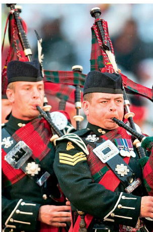
Massed Pipes and Drums.