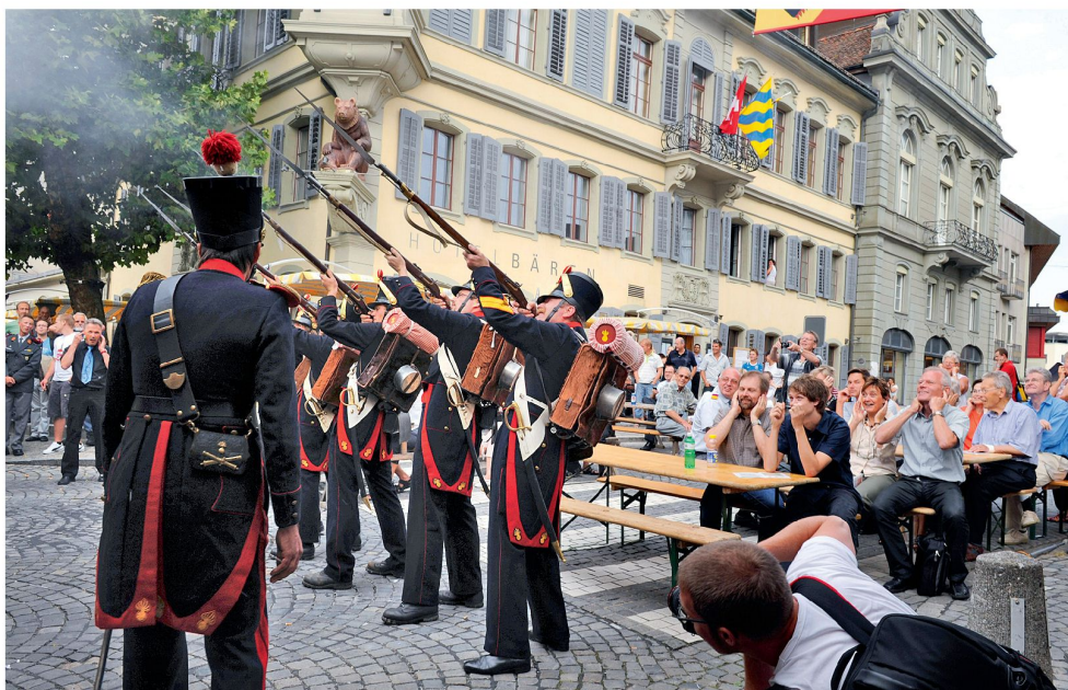
Salutschüsse zum Auftakt des Festes.

Der Initiator des Militär- und Milizfestes, Nationalrat Johann N. Schneider-Ammann, liess in seinen zündenden und magistralen Ansprachen auch den Geist unserer Gründungsväter aufleben und rief die Stärken unseres Landes in Erinnerung. Unabhängigkeit, direkte Demokratie, Vielsprachigkeit, Neutralität und das Milizsystem hätten