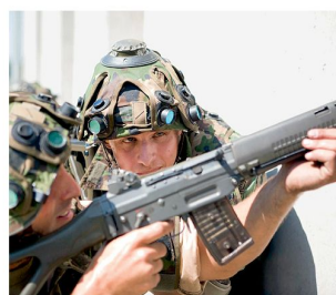
Die Panzergrenadiere des Sicherungszuges bereiten sich auf dem Waffenplatz Bure JU auf die Übung PROTECTOR vor.