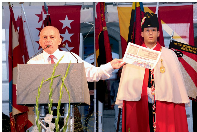
Bundesrat Ueli Maurer als geübter Volksredner.

dass das auch verlangt, aus vertrauten Denkschemen aus-zubrechen und Dogmen hinter uns zu lassen. Gedanklich. Mentalitätsmässig. Unsere Armee braucht einen Schritt vorwärts im Geiste von Langenthal.» Er wandte sich gegen unkritisches Trenddenken und forderte die Besinnung auf unsere spezifisch schweizerische Tradition: «Dass die Schweiz eine ganz andere Wehrtradition hat als beispielsweise die USA oder Grossbritannien, wurde ausgeklammert. Ich plädiere für eine Rückkehr zu Unvoreingenommenheit und zur verfassungstreuen Sachlichkeit.» Und schliesslich meinte er mit eindringlichen Worten: «Vergessen wir nicht: Langenthal war eine Reaktion auf 1798. Damals hatten sich die