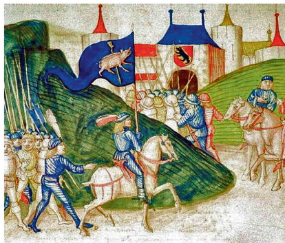
Der Saubannerzug als Beispiel irregulärer Truppen in der Schweiz.

Friedenszustand möglich und die Scheidung von Krieg und Frieden war keineswegs selbstverständlich, sondern musste erst mühsam errungen werden. 6 Eine Unterscheidung zwischen Krieg und Fehde als der eines Kampfes zwischen souveränen Staaten in der Völkerrechtsgemeinschaft und der Fehde als innerstaatliche Auseinandersetzung lässt sich tatsächlich nicht durchführen, weil es im Mittelalter