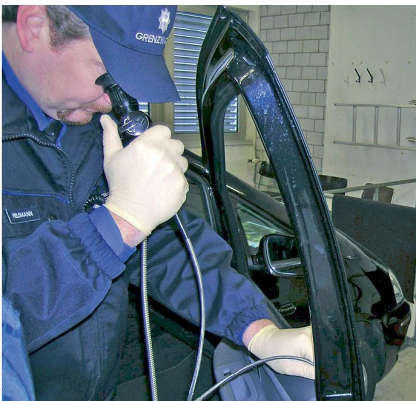
Im Verdachtsfall entgeht kaum ein Versteck dem prüfenden Auge.

Hüben und drüben bestimmen Verträge, mit den Nachbarstaaten geschlossene Staatsverträge und mit jedem einzelnen Grenzkanton getroffene Abmachungen, das Einsatzgebiet des GWK. Die Kontrolle