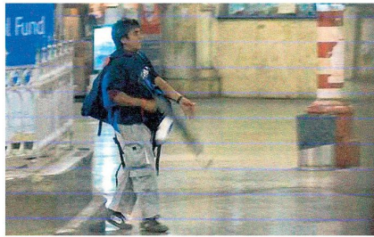
Koordiniertes Blutbad in Mumbai durch Islamisten im November 2008.

Indien hat neben dem besprochenen zentralindischen Gebiet (Naxaliten-Maoisten) noch in zwei andern Regionen zu kämpfen: Kaschmir-Jammu (Djihad-Separatisten) sowie in den Nordost-Ländern (Separatisten und Ethno-Islamisten). Die Ausbildungs- und Logistikbasen der islamistischen Terroristen Indiens befinden sich vorwiegend im Ausland (Pakistan, Afghanistan und Bangladesch). Ihr Verbindungsnetz umfasst 24 asiatische Staaten, vor allem aber auch die Kontakte zu den Taliban, Al Qaida und zur Internationalen Islamischen Front von Osam bin Laden. Seit kurzem nennt sich eine indische Gruppe «Indian Mujahedeer». Ihr Programm richtet sich angeblich als Racheakt gegen Misshandlungen an Moslems auf Destabilisierung der zivilen Autoritäten im ganzen Land. Sie arbeiten zusammen mit dem SIMI (Students Islamic Movement of India), welches schon seit über 30 Jahren in Indien ein islamisches System aufbauen will. Diese Gruppe organisiert auch das Gros der Gotteskämpfer (Selbstmörder) aus dem Pandjab, viele waren ur-