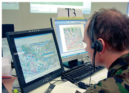
Beschleunigung des Entscheidungsprozesses dank Computern.

Der Entscheidungsprozess besteht aus vielen ständig aufeinander folgenden Schritten: OBSERVE – ORIENT – DECIDE – ACT.