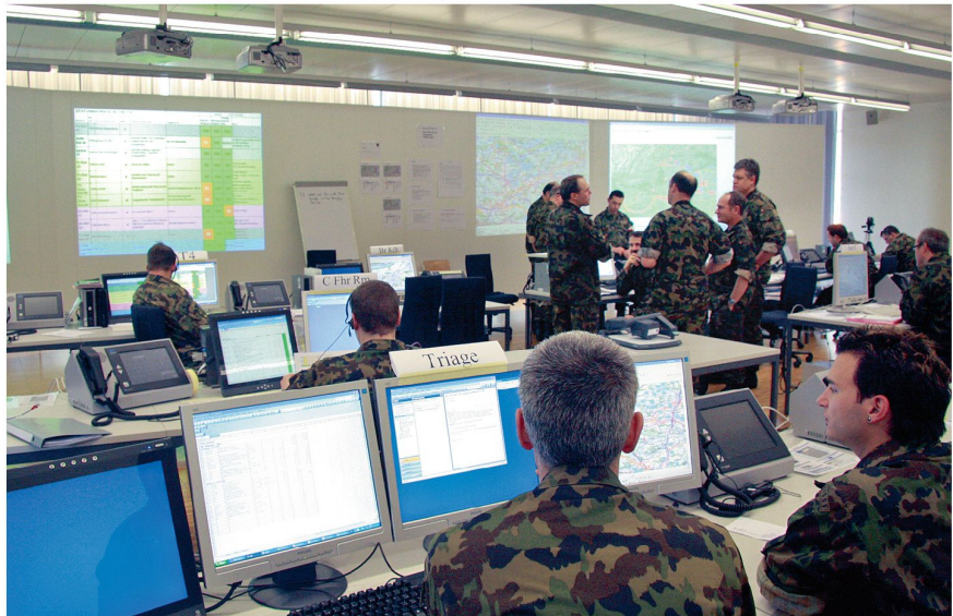
Blick in den Führungsraum einer Brigade.

Grundlage des Orient sind mentale Modelle, Denkmuster. Es ist die Art und