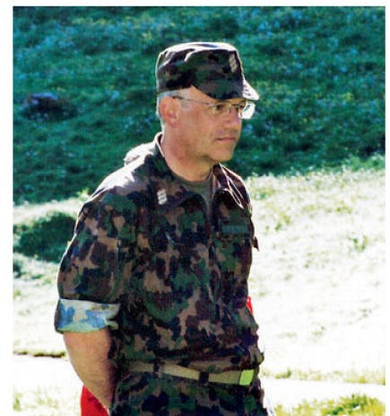
Unsere Rüstungsindustrie ist die Aufwuchsbasis für schwierigere Zeiten.

Wäre der Krisenfall ein Verteidigungsfall, dann sicherlich nicht. Wir bauen ja weder Flugzeuge noch Panzer. Im terroristischen Krisenfall kommt es auf Kommunikationsmittel und auf den