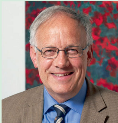
Johann Niklaus Schneider-Ammann