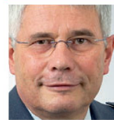
Divisionär Andreas Bölsterli C PSTA Schermenwaldstrasse 13 3063 Ittigen

Der Masterplan-Prozess sowie der Masterplan als Produkt desselben haben in den letzten Jahren zunehmend an Format und Bedeutung gewonnen. Im komplexen und durch stete Veränderungen der Rahmenbedingungen gekennzeichneten Planungsumfeld ist der Masterplan ein unverzichtbares Mittel, um den Überblick zu wahren und nötige Korrekturen der Streitkräfteentwicklung integral abgestützt und im Bewusstsein des damit eingegangenen Risikos vornehmen zu können. ■