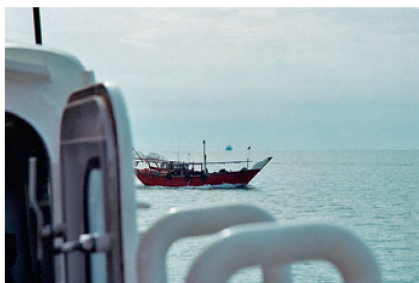
Vom Patrouillenboot USCGS «Monomoy» der U.S. Coast Guard aus wird eine Dhow – typische Boote in der arabisch-somalischen Gewässern – sorgfältig beobachtet. Solche Boote werden immer wieder auch von Piraten genutzt.

Nationen – auch die Schweiz – haben nationale Interessen, die es zuhause wie im Ausland zu wahren gilt. Die Palette von Instrumenten dazu ist breit und erstreckt sich nebst anderen auch auf sicherheitspolitische Mittel. Es ist nicht neu, dass unsere Regierung in Einzelfällen im Ausland die Armee zur Wahrung nationaler Interessen eingesetzt hat. Angehörige der Militärischen Sicherheit haben Botschaften im Ausland geschützt, zudem fliegen sie noch heute im Rahmen der Operation «Tiger Fox» auf Flügeln der Swiss mit. Der Schutz schweizerischer maritimer Interessen hingegen – auf den Weltmeeren fahren 35 Handelsschiffe unter Schweizer Flagge – ist neu. Neu heisst nicht, dass diese Aufgaben