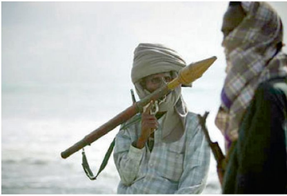
Ein mit einer Panzerfaust RPG-7 ausgerüsteter somalischer Pirat.

gemeinsamer amerikanisch-europäischer Gerichtshof für Piraten in Kenya zu schaffen sei. Auch der deutsche Staatssekretär Schmidt im Bundesministerium der Verteidigung fordert für diese eine internationale Gerichtsbarkeit.