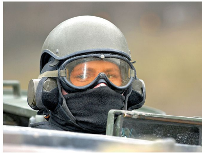
Die tatsächliche Entwicklung der Zukunft bleibt uns leider oft lange verborgen.

Wie ein Nebel der Unsicherheit liegen die zahlreichen nicht vorhersagbaren Faktoren über der Zukunft. Das sicherheitspolitische Umfeld der kommenden 20 Jahre ist alles andere als klar. Gem. herrschender Meinung sei ein konventioneller Konflikt bis auf Weiteres keine Gefahr mehr. Leider ist aber die einzige Konstante in der Geschichte ihre Unvorhersagbarkeit. Saddam wurde vom Verbündeten zum Feind, die Mauer fiel unvorhergesehen, die USA wurden am 11. September überrascht. Freunde werden zu Feinden, aus Potentialen werden Konflikte, aus Streit wird Krieg. Die viel zitierte Vorwarnzeit von mindestens zehn Jahren für einen militärischen Angriff auf die Schweiz ist keine Tatsache, sie ist eine Hypothese. In der Rückschau wird man nach dem nächsten Krieg die-