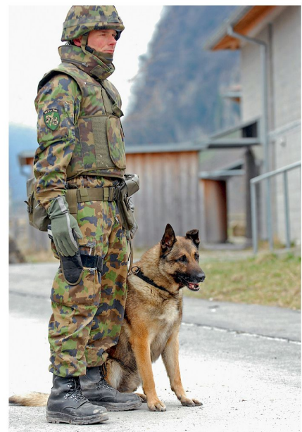
Ob es uns passt oder nicht: Der Strategische Füsilier ist heute Realität.

Bereits 1999 schrieb General Charles C. Krulak (USMC) in einem vielbeachteten Aufsatz: «Micromanagement must become a thing of the past and supervision – that double edged sword – must be complemented by proactive mentoring.» 4 Wenn wir in speziellen Ausnahmesituationen selbstständige Entscheidungen auf der untersten Stufe an die Stelle von Führung durch eine Hierarchie setzen, müssen die Strategischen