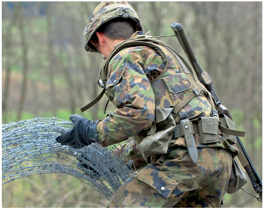
Nicht alle Systeme werden komplexer – aber die meisten.

Es ist im Übrigen ein Mythos, dass Verhältnismässigkeit erst mit den PSO und Raumsicherungsoperationen wichtig geworden ist. In einer Verteidigungsoperation wird der dem Völkerrecht folgende Soldat kapitulierenden Gegnern Pardon gewähren, aber fliehende gegnerische Kräfte weiter bekämpfen. Das ist nicht nur rechtens, sondern auch verhältnismässig. Wir müssen erkennen, dass die Ausbildung von Verhältnismäs-