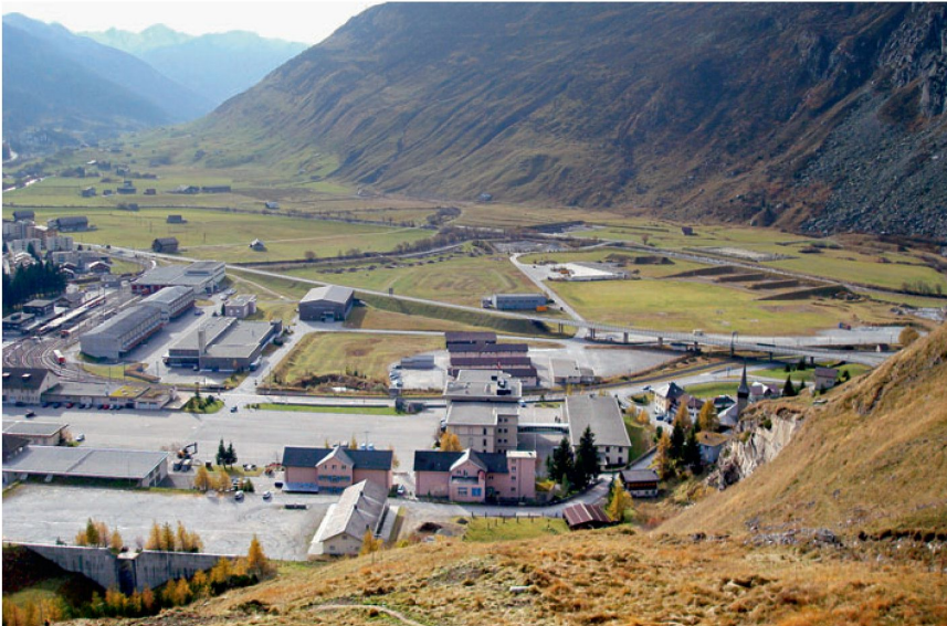
Abb. 2: Von der Gebirgskampfschule zum Tourismusressort: Andermatt als Ausnahmefall

fehlender planungsrechtlicher Grundlagen – als sehr hoch eingeschätzt.