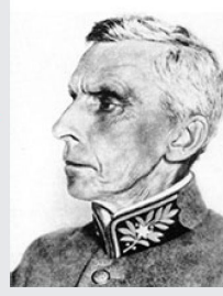
Generalstabschef Theophil Sprecher von Bernegg (1850–1927).