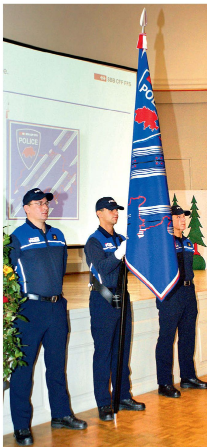
Neue Korpsfahne der SBB Police.

Nach ersten Versuchen entstand 2001 die Securitrans AG, gegründet von den SBB, die 51 Prozent des Aktienkapitals hielten, und der Securitas AG (49 Prozent). Ihre drei Geschäftszweige beschäf-