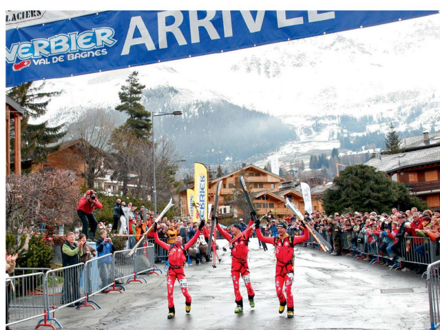
Zieleinlauf in Verbier 2009.