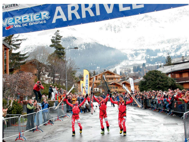
Zieleinlauf in Verbier 2009.