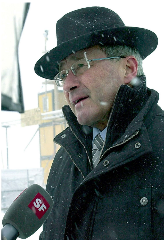
Der Sicherheitschef des WEF trotzte vielen Stürmen.

Weit über seinen Kanton hinaus prägte er die Schweizer Polizei. Als Experte würdigte man ihn und seinen Rat in den Nachbarländern. Wesentlich trug er in Kursen des Schweizerischen Polizei-Institutes dazu bei, eine ganze Generation von jungen Polizeioffizieren zu formen und für anspruchsvolle Aufgaben zu schulen. 1993 bis 1996 präsidierte er die Konferenz der Kantonalen Polizeikommandanten. Gerade weil er immer kameradschaftlich bescheiden