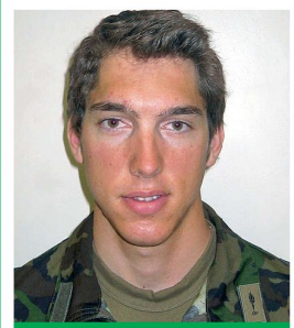
Carlo Janka, Olympiasieger im Riesenslalom, hat die Spitzensport-RS 1/07 absolviert.