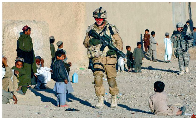
Schutz der Bevölkerung – eine wichtige Aufgabe der Streitkräfte.

der eindimensionalen Sichtweise aus dem Kalten Krieg leider aus dem Fokus geraten. Gegenwärtig entwickelt das Zentrum für Transformation der Bundeswehr im Rahmen eines interdisziplinären Ansatzes mögliche Zukunftsszenarien, mit denen sich die Bundeswehr resp. Europa und die NATO auseinandersetzen haben. Bereits heute zeichnet sich ab, dass mit Blick auf diese multidimensionalen Bedrohungen die Streitkräfte mit neuen Anforderungen konfrontiert werden, die diverse neue Fähigkeiten und Mittel notwendig machen. Dabei zeigt sich, dass bei den aktuellen multinationalen Militäreinsätzen in Krisenregionen (beispielsweise in Afghanistan) mindestens ansatzweise bereits heute solche Forderungen an die eingesetzten Truppen gestellt werden. Beispiele sind der Kampf gegen irreguläre und terroristische Gruppen, Schutz und Unterstützung der Zivilbevölkerung oder auch der umfassende und hohe Schutzgrad, der bei den Truppen im Einsatz verlangt wird.