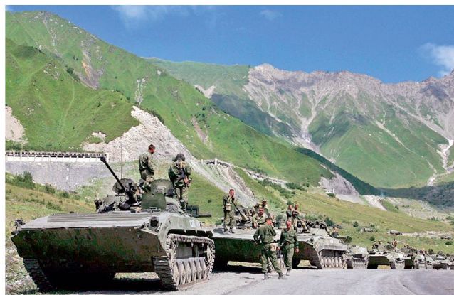
Vorstoss russischer Mot Schützen mit BMP-2.

Verwendung veralteter Artilleriegranaten und Bomben führte u. a. auch zu einer grossen Zahl von Blindgängern. Ein weiterer Schwachpunkt war bei den unzureichenden Aufklärungsmitteln zu erkennen und dies sowohl auf der operativen wie auf der taktischen Ebene: Die militärische Führung kritisierte dabei die geringe Auflösung der Satellitenaufklärung sowie die mangelnden Fähigkeiten der taktischen Aufklärungsmittel. Dazu soll