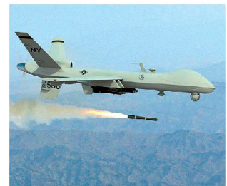
Zahl der bewaffneten UAV's wird weiter zunehmen.

2020 zurückgehen. Diese Bestandesreduktion soll durch die laufende Zuführung von Jagdflugzeugen der fünften Generation (u. a. F-35) aufgefangen werden. Bis 2020 sollen etwa 1000 Maschinen