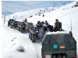
Schwierige Einsatzbedingungen für Bundeswehr in Afghanistan.

Mittel zur Verfügung stehen, die für einen bestmöglichen Schutz der eingesetzten Truppen notwendig seien. So fehl-