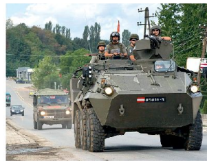
Schützenpanzer «Pandur» bei der KFOR im Kosovo.

Bei der KFOR im Kosovo stellt Österreich weiterhin ein vermindertes Infanteriebataillon, das innerhalb der Multinationalen Task Force South (MNTF-S) eingesetzt ist. Der Gesamtbestand des österreichischen Kontingents im Kosovo beträgt derzeit etwa 430 Soldaten. Trotz des im Jahre 2006 beschlossenen Rückzugs aus der ISAF in Afghanistan