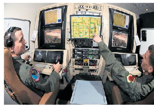
Führung und Einsatzplanung von UAV's benötigt viel Personal.

Tempo der Indienststellung neuer Drohnensysteme (UAV-Systeme) mithalten. Denn für die Führung und Einsatzplanung von ferngelenkten UAV's wird eine grosse Zahl von Piloten und Spezialisten benötigt. Die Air Force rief daher pensionierte Piloten auf, sich für die freiwillige Reaktivierung zu melden. In den letzten Monaten sollen sich gemäss Pentagon mehr als 1000 Offiziere a.D. gemeldet