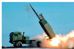
Mehrfachraketenwerfer «HIMARS» in Afghanistan.

auch GPS-gelenkte Minenwerfergranaten 120 mm zum Einsatz gelangen. Leichte Mehrfachraketenwerfer vom Typ «HIMARS» mit sechs Abschussrohren werden seit einiger Zeit in Afghanistan eingesetzt. Sie ermöglichen die frühzeitige Bekämpfung feindlicher Ziele bis maximal 70 km, wobei leistungsfähige Aufklärungs- und Feuerleitmittel notwendig sind. Bei Operationen im urbanen Umfeld werden die Systeme «HIMARS» gegen unterschiedliche Ziele eingesetzt, wobei damit auch vermehrt erkannte Sprengfallen über grössere Distanzen bekämpft werden sollen. Aber