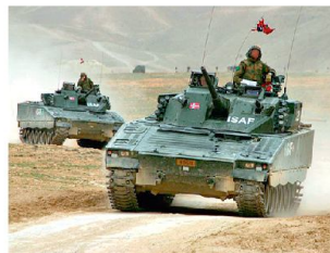
Schützenpanzer CV-9030 im Auslandeinsatz.

rund 3500 Wehrdienstpflichtige. Für die separate Heimatverteidigung stehen rund 47 000 Reservisten zur Verfügung.