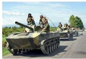
Geschütze 120 mm 2S9 auf der Verschiebung.

teten Waffen und Geräte, die bei den russischen Truppen im Kaukasus immer noch vorhanden sind. So kamen bei den eingesetzten Truppen der 58. Armee nur ungenügend gepanzerte Fahrzeuge (hauptsächlich BTR-70/BTR-80 und BMP-1/BMP-2) sowie veraltete Kampfpanzer (T-72M und teilweise noch T-55M) zum Einsatz. Zudem sollen die veralteten optronischen und übermittlungstechnischen Geräte die Einsatzfähigkeit nachteilig beeinflusst haben. Bei der Artillerie zeigten sich Mängel bei der Feuerführung und Feuerleitung, die beispielsweise ein rechtzeitiges Konterbatteriefeuer verunmöglicht hätten. Dazu kam das Fehlen moderner Munitionstypen, insbesondere von Präzisionsmunition für Geschütze 152 mm. Die