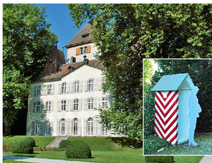
Schloss Jegenstorf, Südostfassade. HQ des Generals 09.10.1944 – 19.08.1945.

Dieses Treffen hat also nicht stattgefunden, hingegen haben Mitglieder der Sektion Schweiz der Clausewitz-Gesellschaft am 1. September 2010 die Sonderausstellung «General Henri Guisan zum 50. Todestag» im Schloss Jegenstorf unter kun-