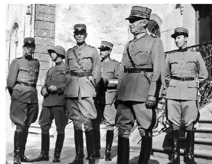
Der General mit seinem persönlichen Stab vor dem Schlosseingang.