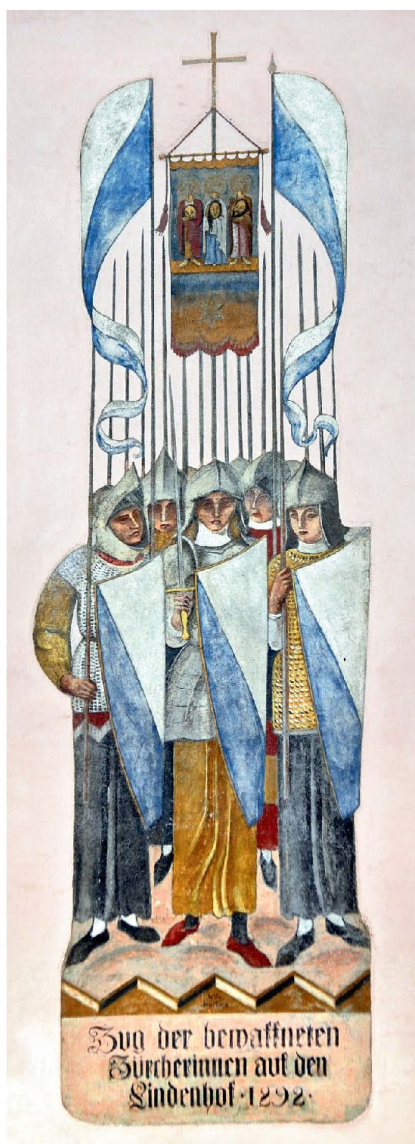
Nur ein Bluff oder reale Möglichkeit? Zug der bewaffneten Zürcherinnen auf den Lindenhof im Jahr 1292.

Diese Erwägungen sind in mehrerer Hinsicht nicht ganz zutreffend: Zwar ist es richtig, dass die Vertragsstaaten über die Organisation der Armee bestimmen können, das heisst über die allgemeine Wehrpflicht und das Milizsystem. Nicht der Disposition der Vertragsstaaten unterliegt aber die Gleichbehandlung der Geschlechter, diese muss unabhängig von der Wahl der Wehrorganisation gewährleistet werden. Ebenso unzutreffend ist die Annahme, in der Schweiz sei eine Wehrpflicht für Frauen nie in Erwägung gezogen worden. Die Einführung von militärischen und zivilen Dienstpflichten für Frauen wurde in der Schweiz seit Anfang des 20. Jahrhunderts wiederholt thema-