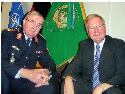
General Manfred Lange mit dem Redaktor ASMZ.

künftig darauf einstellen, das gesamte Fähigkeitsspektrum zur Anwendung zu bringen. Auf der anderen Seite denke ich, dass ein anspruchsvoller «level of ambition» letztlich motivierender für die Ausbildung und auch für die Bereitschaft der Nationen ist, als ein zu niedrig gewählter. Wenn man das Niveau der Fähigkeiten trotz geringerer Mittel und trotz einer verschlankten Kommandostruktur so hoch halten will, dann müssen sich die Nationen auch daran messen lassen. Ob das dann alles so zusammenpasst und ob das alles am Ende auch wirklich ernsthaft und wahrhaft umgesetzt werden kann, das werden wir in den kommenden Jahren sehen.