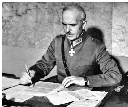
Generalleutnant Oesch am Arbeitstisch.

Obwohl der erfolgreiche Verlauf der Abwehrschlacht der ausserordentlichen Führungsleistung von Generalleutnant Oesch zu verdanken war, wurde der spätere Ruhm dem alternden Marschall Mannerheim zuteil. Dies mag auch eine Folge seiner politischen Leistungen sein. Mannerheim erzwang den Abzug der deutschen Wehrmacht aus Finnland, schloss den Waffenstillstand mit der UdSSR und wurde schliesslich zum gefeierten finnischen Staatspräsidenten gewählt.