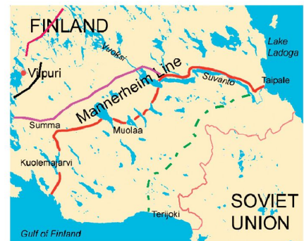
Mannerheimlinie Karelien 1944.