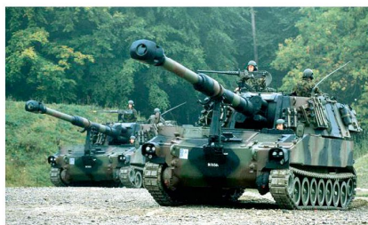
Das System Artillerie ist mehr als nur Geschütze – aber ohne Geschütze kann kein System Artillerie glaubwürdig betrieben werden.

Seit etwas mehr als hundert Jahren wird die Artillerie systematisch im indirekten Schiessen eingesetzt. Dies erfordert eine Aufklärungskomponente, die Ziele beurteilt und Feuerbefehle erteilt, eine Rechenkomponente, welche die Zielkoordinaten in Schiesselemente umrechnet und schliesslich auch Geschütze. Da stets mehr Ziele als Feereinheiten vorhanden sind, ist die Priorisierung der Ziele und die Zuweisung von Feereinheiten einer der wichtigsten artilleristischen Prozesse, der eng mit den Kommandanten der Kampftruppen geführt werden muss. Dafür werden die entsprechenden Telekommunikationsmittel und Verbindungen für Daten und Sprache benötigt. Und nicht zuletzt kommt der Logistik beim Grossverbrau-