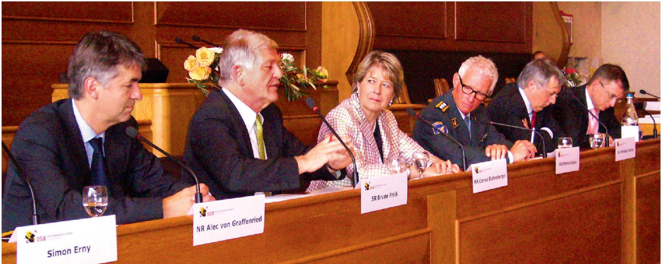
Illustres Podium am sicherheitspolitischen Forum im Berner Rathaus.

Krisensituationen hervor. Seine Ausführungen gipfelten in einer Hymne an das Milizprinzip, welches das eigentliche Erfolgsgeheimnis der Schweiz sei.