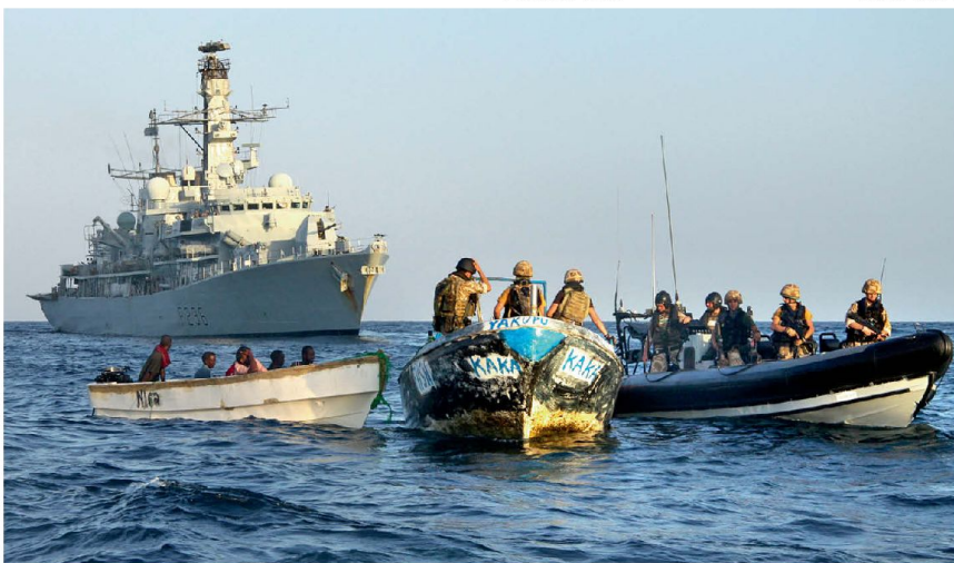
Operation ATALANTA: HMS Montrose greift Piraten auf.

Die EU steht heute nicht nur in der Wirtschafts- und Währungsunion an einem Scheideweg, sondern ebenso bei der gemeinsamen Sicherheits- und Verteidigungspolitik. In beiden Bereichen stellt sich die Kernfrage, wie weit die 27 EU-Länder in Zukunft bereit sein werden, auf bisher bedeutsame Souveränitätsrechte zu Gunsten des Kollektivs der EU zu verzichten. Bisher scheint man vor allem darin übereinzustimmen, die «Entwicklung Europas zu einer globalen Gestaltungskraft» vorantreiben zu wollen, wie es kürzlich in einem Arbeitspapier der EU ausgedrückt wurde. Dies ist aber nach der dezidierten Meinung des höchsten militärischen Repräsentanten der EU nur zu haben, wenn die EU-Länder bereit sind, den hohen Preis des nationalen Souveränitätsverlustes im Bereich Sicherheit und Verteidigung zu zahlen. Damit verbunden sind derart heikle Fragen wie