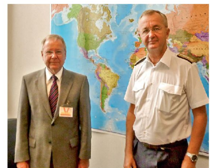
General Syrén mit dem Autor im HQ der EU.

Die EU steht heute nicht nur in der Wirtschafts- und Währungsunion an einem Scheideweg, sondern ebenso bei der gemeinsamen Sicherheits- und Verteidigungspolitik. In beiden Bereichen stellt sich die Kernfrage, wie weit die 27 EU-Länder in Zukunft bereit sein werden, auf bisher bedeutsame Souveränitätsrechte zu Gunsten des Kollektivs der EU zu verzichten. Bisher scheint man vor allem darin übereinzustimmen, die «Entwicklung Europas zu einer globalen Gestaltungskraft» vorantreiben zu wollen, wie es kürzlich in einem Arbeitspapier der EU ausgedrückt wurde. Dies ist aber nach der dezidierten Meinung des höchsten militärischen Repräsentanten der EU nur zu haben, wenn die EU-Länder bereit sind, den hohen Preis des nationalen Souveränitätsverlustes im Bereich Sicherheit und Verteidigung zu zahlen. Damit verbunden sind derart heikle Fragen wie