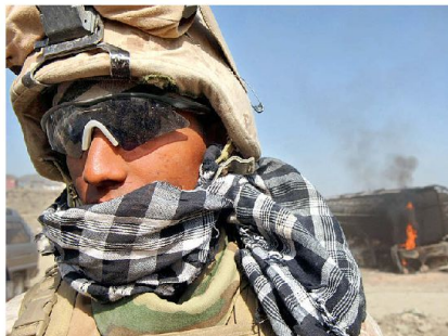
Stillstand in Afghanistan: die Strategie ist festgefahren und die Energie verpufft ohne Wirkung.

Dass aus Sicht der Vereinigten Staaten noch einiges zum Innenleben der Entscheidungsfindung im Vorfeld der Einmischung