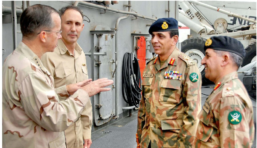
Fruchtlose Debatte: die USA und Pakistan haben immer weniger gemeinsame Interessen.

Der Preis, den vor allem die Vereinigten Staaten in diesem Konflikt zahlen, ist hoch und das nicht nur in rein finanzieller Sicht. Die Problematik der sogenannten «Oppositional Soldiers», also aktiven Angehörigen der Streitkräfte, welche die militärischen Einsätze der Vereinigten Staaten ablehnen, welche bisher für Afghanistan relativ wenig