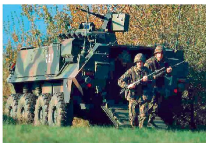
Wer Verteidigung beherrscht meistert auch andere Aufgaben, aber nicht umgekehrt!