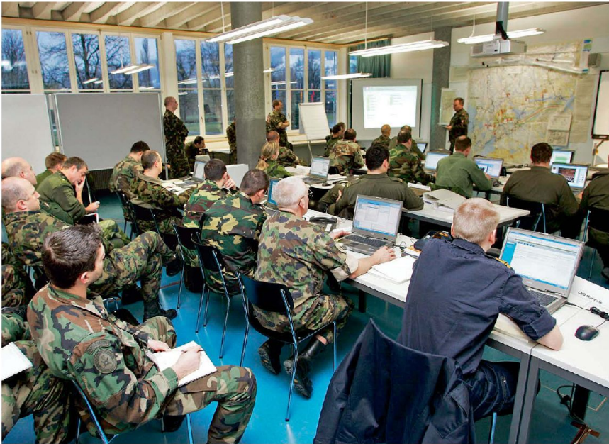
Bilder 2 bis 4: Arbeit in einem multinationalen HQ (Multinationale Stabsübung VIKING 05, Luzern 2005).

sind. Dieses Fundament wiederum wird von unterschiedlichen internen Faktoren (strukturelle, prozessuale, personelle oder kulturelle) beeinflusst.