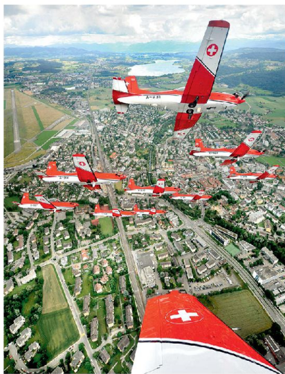
Das PC-7 Team über der Stadt Dübendorf

Man halte sich einmal die von Avenir Suisse propagierte Idee einer gigantischen «Betonwüste» mit 15 000 Wohnungen für rund 30 000 Menschen auf der aktuellen Magerwiese vor Augen, unter deren Oberfläche in nur sechs Meter Tiefe ein Grundwassersee liegt, der die Einwohner der Stadt Dübendorf mit Wasser versorgt. Oder wie mögen wohl die Augen der gestressten Pendler leuchten, die schon heute das Brüttiseller Autobahnkreuz im Schrittempo durchqueren, wenn sich dereinst weitere zigtausend Menschen in