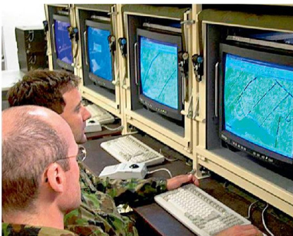
Feuerführungszentrum auf Stufe Brigade.

Diese Rechnung lässt sich analog zu anderen Gebieten (Material, Ausbildungspersonal oder Infrastruktur) anhand von vier Schritten qualitativ und quantitativ durchführen und anschliessend in verschiedenen Stressszenarien testen. Weil wir nicht vor einer unmittelbaren Bedrohung stehen und weil die