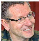
Divisionär Jean-Marc Halter Chef Führungsstab der Armee 3003 Bern

Für die Armee ist und bleibt die militärische Friedensförderung eine einmalige Gelegenheit, Erfahrungen in einem echten Einsatzrahmen zu erhalten. Dabei profitiert jeder eingesetzte Armeemitglied sowohl auf der fachlichen wie auch auf der persönlichen Ebene, gilt es doch, Herausforderungen zu meistern, mit Stress und Unsicherheit umzugehen und unter echtem Zeitdruck Entscheidungen zu treffen. Institutionell gewinnt die Armee zum einen, indem sie ihr Material sowie ihre Verfahren und Methoden in der Realität prüfen kann. Zum anderen profitiert sie vor allem vom Erfahrungsgewinn der eingesetzten Berufskader. Somit ist heute unbestritten, dass auch der Einsatz in der militärischen Friedensförderung zum modernen Berufsbild eines Soldaten gehört. ■